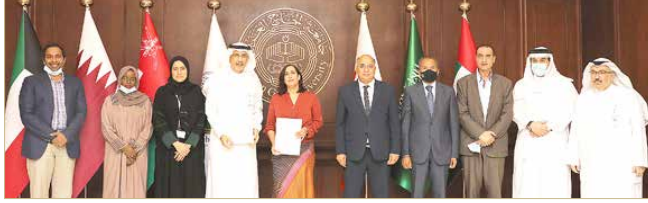
المنامة - جامعة الخليج العربي

وقعت الهيئة الوطنية لتنظيم المهن والخدمات الصحية (NHRA)، امس، اتفاقية تعاون مع جامعة الخليج العربي لمدة خمس سنوات قابلة للتجديد، حيث تقوم بموجبها الجامعة بفحص الأدوية الواردة إلى مملكة البحرين والمقدمة من الجهات المستوردة للأدوية والشركات الصيدلانية في مختبر ضمان الجودة التابع للجامعة لإصدار إفادة للهيئة الوطنية لتنظيم المهن والخدمات الصحية بأن الأدوية مطابقة للمواصفات الضرورية، قبل الموافقة عليها من قبل الهيئة الوطنية لتنظيم المهن والخدمات الصحية لتداولها. ووفقاً لهذه الاتفاقية، ستقوم جامعة الخليج العربي بتسخير بنيتها التحتية ومعداتها المتقدمة وكوادرها العلمية لتأسيس مختبر ضمان جودة الأدوية، والمحافظة على معايير الجودة لضمان التميز في اختبارات الأدوية والمستحضرات