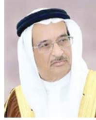
الشيخ محمد بن عبدالله آل خليفة

المتعدد، بدعوة جميع المصابين في دول العالم للتواصل والتعرف على مستجدات المرض ومشاركة بعضهم البعض من أجل تنمية علاقات إنسانية مع الآخرين وتذليل العقبات والحوجز الاجتماعية التي تواجههم في سبيل دمجهم في المجتمع والاحتفاء بشبكات الدعم وتأييد الرعاية الذاتية. وتسعى الاحتفالية بهذه المناسبة للمطالبة بقرارات رسمية وموحدة بين الحكومات في كل دول العالم لضمان تقديم خدمات أفضل ورسم خريطة طريق لقوانين العمل للأشخاص المصابين بالتصلب المتعدد، مع تزايد أعداد المصابين