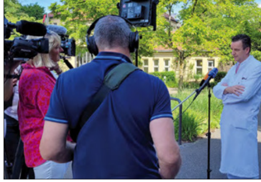
كبير أطباء علم العدوى في عيادة ميونيخ شواينيج يجيب على أسئلة الصحفيين بعد أن اكتشفت ألمانيا أول حالة إصابة بجدري القروء.

عواصم - وكالات: أعلنت إسرائيل تسجيل إصابة بجدري القروء، السبت، وهي الأولى في الشرق الأوسط بعد رصد عدة دول في أوروبا وأمريكا الشمالية إصابات بالمرض المتوطن في أجزاء من أفريقيا. وقال المتحدث باسم مستشفى إيكيلوف في تل أبيب لوكالة فرانس برس إنه تأكدت إصابة رجل يبلغ 30 عاما بجدري القردة بعد عودته مؤخرا من أوروبا الغربية حاملا أعراض المرض. وكانت وزارة الصحة قد أفادت، الجمعة، بأن الرجل خالط شخصا مصابا بجدري القردة في الخارج، مشيرة إلى أنه تم أخذ عينة لفحصها ووضع في الحجر في مستشفى إيكيلوف وأعراض الإصابة خفيفة.