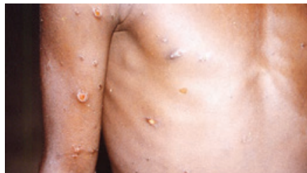
○ جدري القردة يظهر بشكل طفح جلدي مميز.

ظهور عدد أكبر من الإصابات مع تجمع الناس في مهرجانات ومخيمات خلال أشهر الصيف المقبلة في أوروبا ومناطق أخرى. ○ كيف يمكن حماية الناس من العدوى.. بدأت بريطانيا في تطعيم العاملين في مجال الرعاية الصحية الذين قد يكونون معرضين لمخاطر أثناء رعاية المرضى بلقاح الجدري والذي يمكن أن يبقى أيضا من جدري القردة. وتقول الحكومة الأمريكية إن لديها ما يكفي من لقاح الجدري المخزن في مخزونها الوطني الاستراتيجي لتطعيم جميع سكان الولايات المتحدة. وقال المتحدث باسم وزارة الصحة والخدمات الإنسانية الأمريكية في بيان إن هناك أدوية معادة للفيروسات للجدري يمكن استخدامها أيضا لعلاج جدري القردة في ظل ظروف معينة. وعلى نطاق أوسع يقول مسؤولو الصحة إنه يجب على الأشخاص تجنب المخالطة الوثيقة لشخص مصاب بطفح جلدي أو يبدو مريضا. ويجب على الأشخاص الذين يشبهون في إصابتهم بجدري القردة عزل أنفسهم وتطلب الرعاية الطبية. ○ ما هو السبب الذي قد يكون وراء الارتفاع في الإصابات.. قالت أجيلا رامسون عالمة الفيروسات في منظمة المتقدمات والأمراض المعدية بجامعة ساسكسطن إنكتنا إن الفيروسات ليست شيئا جديدا وهي متوفرة، وأضافت أن عددا من العوامل جعل من ظهور وانتشار الفيروسات من بينها زيادة السفر على مستوى العالم وتغير المناخ. وقالت إن العالم أيضا في حالة تأهب أكبر لعمليات تفش جديدة لأي نوع من الفيروسات في أعقاب جائحة كوفيد-١٩.